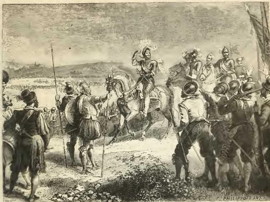
Henri IV à Ivry.

devant de l'ennemi. Le 13 mars, les deux armées furent en présence dans la plaine de Saint-Audré, entre Nonancourt et Ivry, près de la rivière d'Eure.