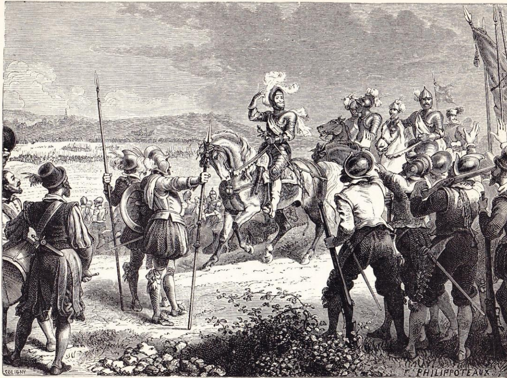
Henri IV à Ivry (Mars 1590).

Parue précédemment au moins, à la page 253, dans Henri MARTIN , Histoire de France populaire depuis les temps les plus reculés jusqu'à nos jours (Paris, librairie Furne – Jouvett et Cie éditeurs, tome deuxième (1867 ?), 580 pages :